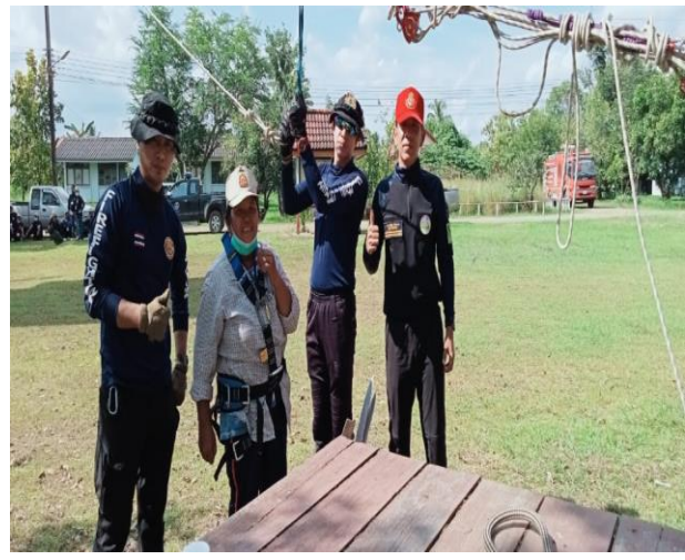
ภาพประกอบโครงการป้องกันอัคคีภัยในชุมชนและสถานประกอบการ ๒๕๖๕