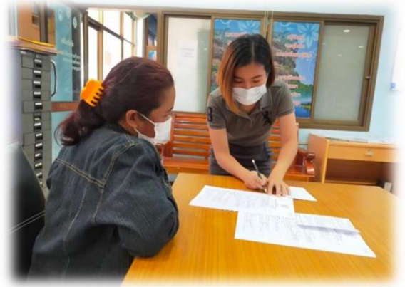
รูปภาพประกอบ การรับเงินเบี้ยยังชีพผู้สูงอายุ/ผู้พิการ