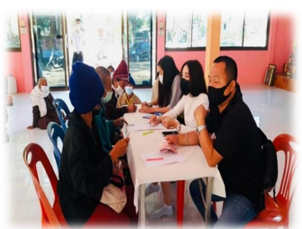
โครงการป้องกันและแก้ไขปัญหาการตั้งครรภ์ไม่พร้อมในวัยรุ่น