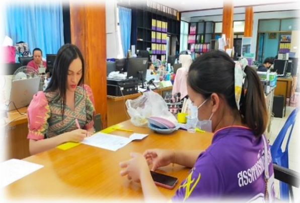
รูปภาพประกอบ การรับลงทะเบียนโครงการเงินอุดหนุนเพื่อเลี้ยงดูเด็กแรกเกิด